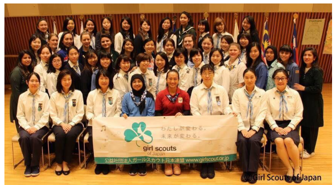
▲ Japan International Youth Event 2019 にて

もちろん日々の団や県連盟の活動も大好きですが、世界のガールスカウトと活動することもスカウト活動の醍醐味の1つだと思います。私たちには、世界中に1000万人の姉妹がいて、同じモットー、やくそくの下、活動しています。そのことをぜひ多くのスカウトに肌で感じてほしいと思っています。私は世界連盟歌を海外のスカウトとともに歌った時の感動が忘れられません！