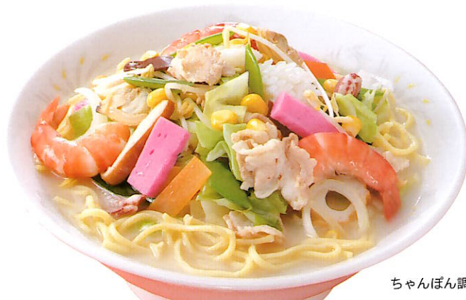
ちゃんぽん調理例

販売者/島手そうめん販売株式会社 長崎県諫早市津久葉町5-142 TEL 0957-25-8033 FAX 0957-25-8801