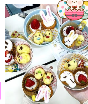
Rr.スカウトがたくさん来てくれました♡